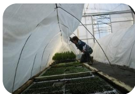
Découverte de la Production Agricole