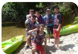
Le climat éducatif