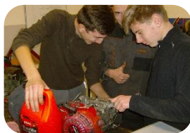
Découverte de la Vente et la motoculture