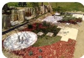
Découverte de l'Espace Vert